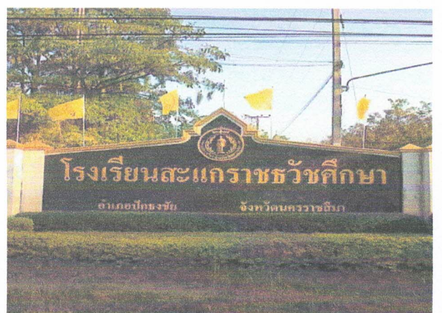
ตัวอย่างป้ายที่ไม่ต้องเสียภาษี