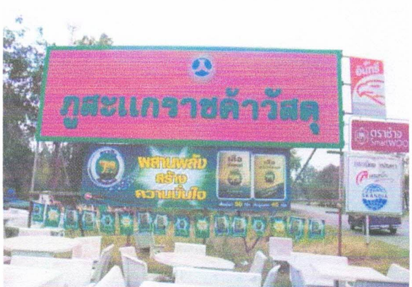
ตัวอย่างป้ายที่เสียภาษี